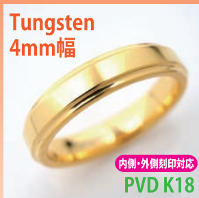
商品番号:1710122 サイズ:5-21号(奇数) 約4.0~5.0g 4,200円