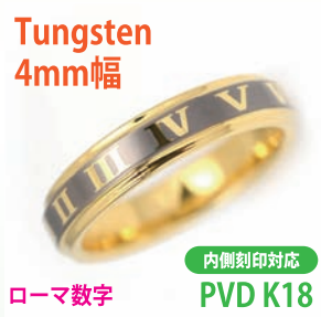
商品番号:1710142 サイズ:5-21号(奇数) 約4.2~5.0g 4,500円