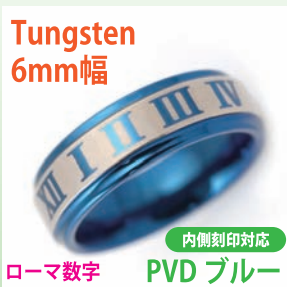
商品番号:1710154 サイズ:7-23号(奇数) 約7.5~10.5g 5,100円