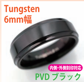
商品番号:1710135 サイズ:7-23号(奇数) 約7.5~10.5g 4,800円