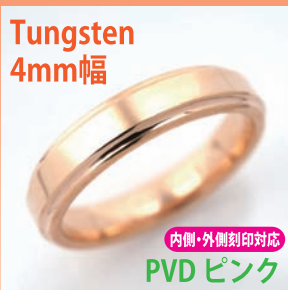
商品番号:1710123 サイズ:5-21号(奇数) 約4.0~5.0g 4,200円