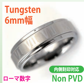
商品番号:1710151 サイズ:7-23号(奇数) 約7.5~10.5g 4,500円