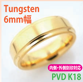
商品番号:1710132 サイズ:7-23号(奇数) 約7.5~10.5g 4,800円