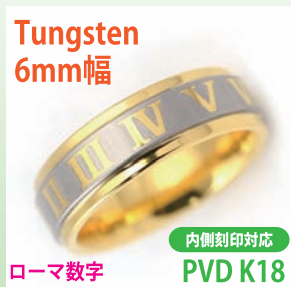
商品番号:1710152 サイズ:7-23号(奇数) 約7.5~10.5g 5,100円