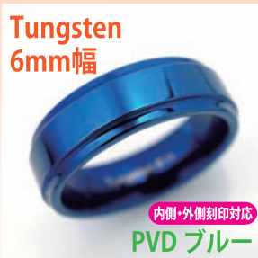
商品番号:1710134 サイズ:7-23号(奇数) 約7.5~10.5g 4,800円