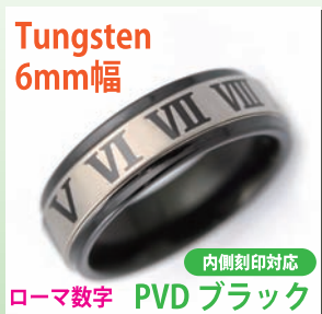
商品番号:1710155 サイズ:7-23号(奇数) 約7.5~10.5g 5,100円