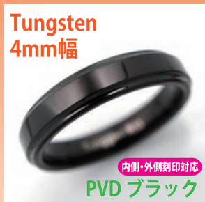
商品番号:1710125 サイズ:5-21号(奇数) 約4.0~5.0g 4,200円