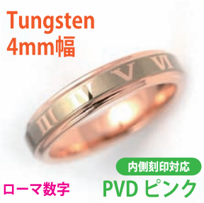
商品番号:1710143 サイズ:5-21号(奇数) 約4.2~5.0g 4,500円