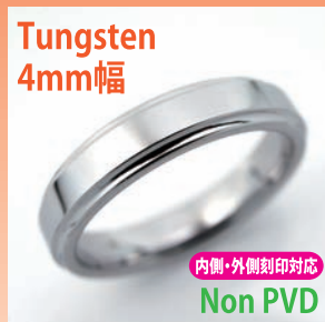
商品番号:1710121 サイズ:5-21号(奇数) 約4.0~5.0g 3,600円