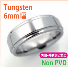
商品番号:1710131 サイズ:7-23号(奇数) 約7.5~10.5g 4,200円