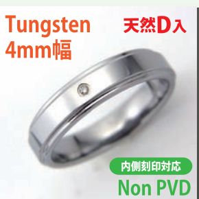
Tungsten 天然D入 4mm幅