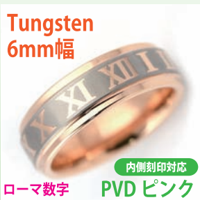
商品番号:1710153 サイズ:7-23号(奇数) 約7.5~10.5g 5,100円