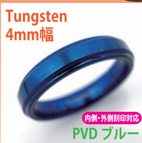
商品番号:1710124 サイズ:5-21号(奇数) 約4.0~5.0g 4,200円