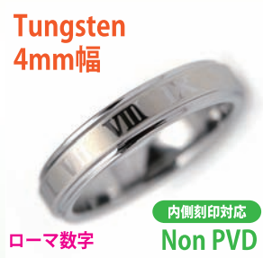
商品番号:1710141 サイズ:5-21号(奇数) 約4.2~5.0g 3,900円