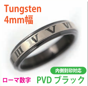
商品番号:1710145 サイズ:5-21号(奇数) 約4.2~5.0g 4,500円