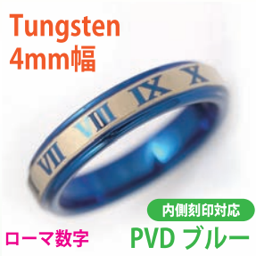
商品番号:1710144 サイズ:5-21号(奇数) 約4.2~5.0g 4,500円