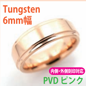
商品番号:1710133 サイズ:7-23号(奇数) 約7.5~10.5g 4,800円